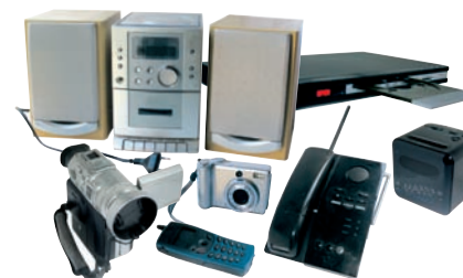
AUDIO / VIDÉO / TÉLÉPHONIE