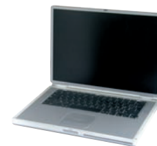
ORDINATEURS PORTABLES / ÉCRANS