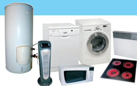
LAVAGE / CUISSON / CHAUFFAGE