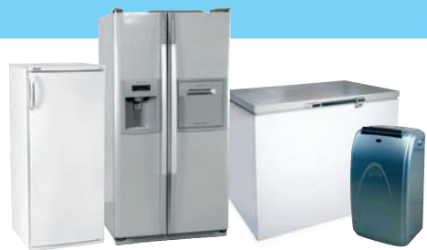
RÉFRIGÉRATEURS / CONGÉLATEURS / CLIMATISEURS