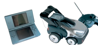
JOUETS / LOISIRS