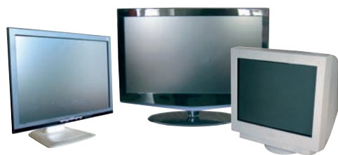
TÉLÉVISEURS / MONITEURS